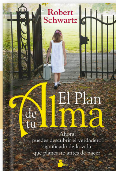
El plan de tu alma (Robert Schwartz)

En este libro podrás descubrir el verdadero significado de la vida que planeaste antes de nacer.