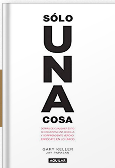
"Solo una cosa" (Gary Keller y Jay Papasan)

En él encontrarás que la clave del éxito es pensar en grande y actuar en pequeño, como siempre digo el elefante se come de pedacito en pedacito.